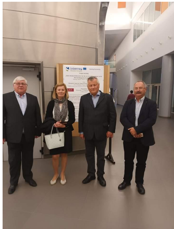
A projektvezetők magyar résztvevőkkel