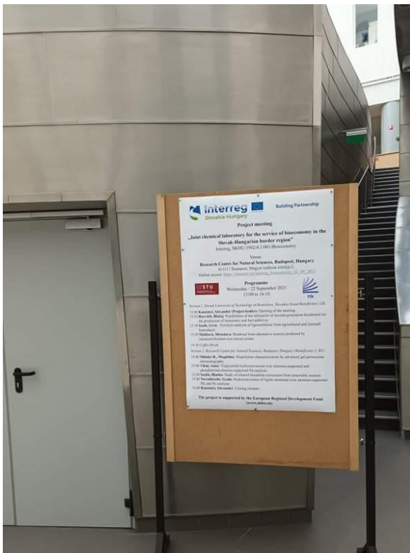
A találkozók plakátja a TTK aulájában