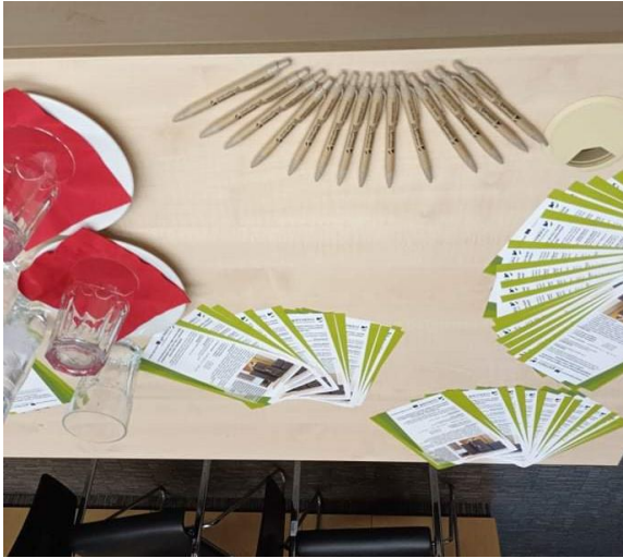
Szórólapok és ajándéktollak