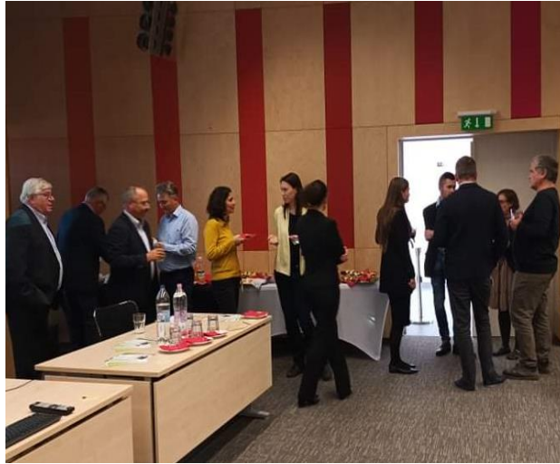
Kötetlen beszélgetés a találkozó szünetében